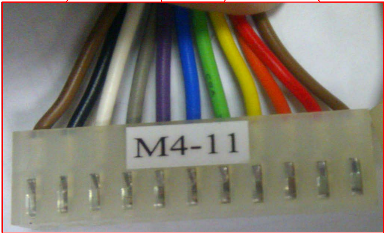
M4-11 範例圖 ↑