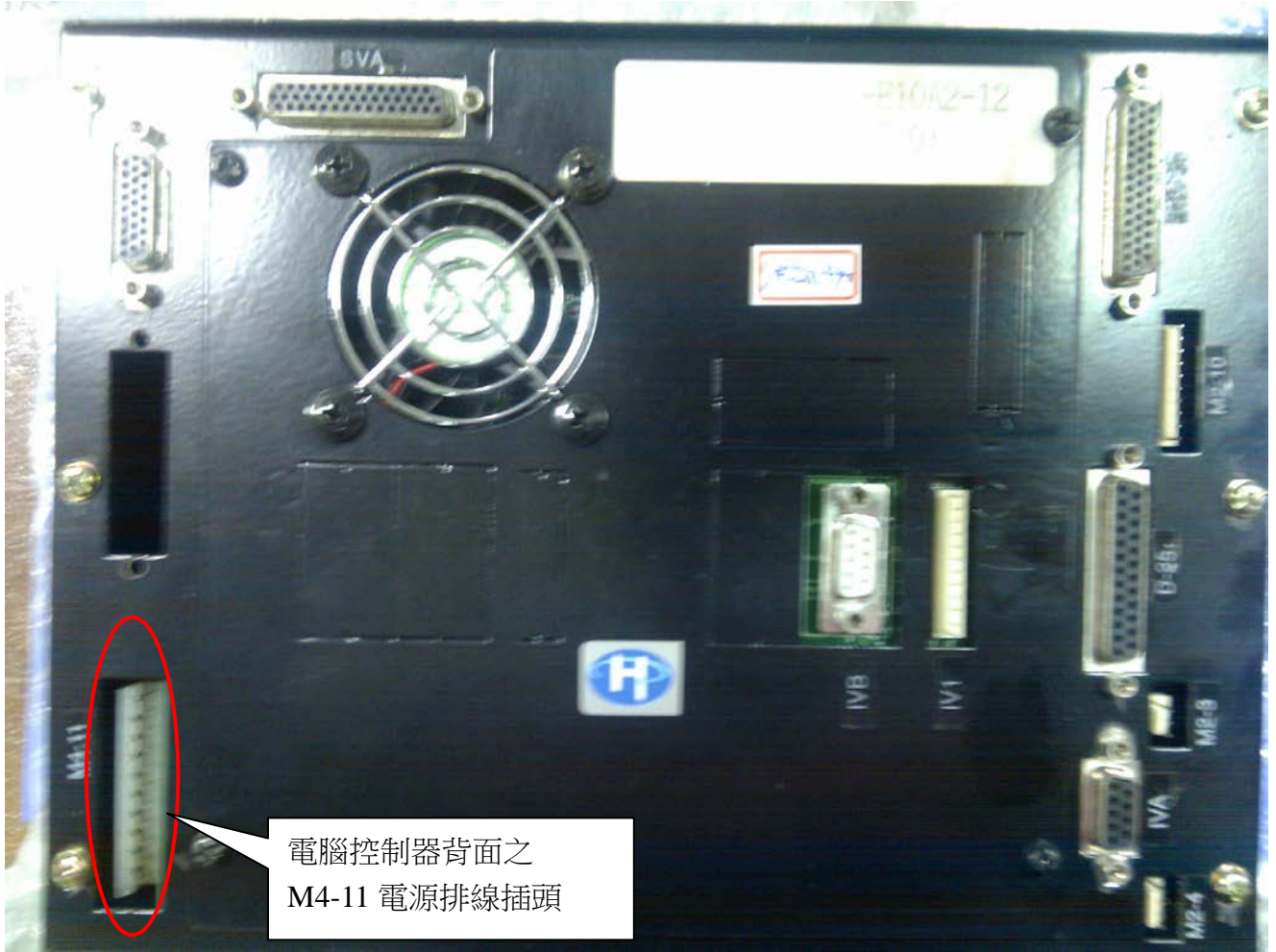
電腦控制器背面之 M4-11 電源排線插頭

5.如狀況仍未排除，請利用攝影或拍照的方式，將電源供給器上的燈號及整個控制箱內的情況(開機的狀況下)拍攝下來，回傳給我參考